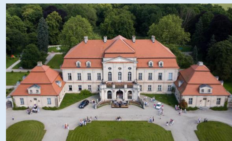
Pępowo – pałac z końca XVII wieku, spotkanie z właścicielem