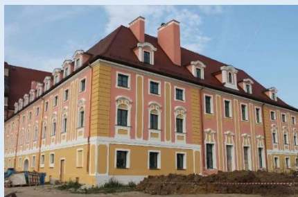
Głębowice – zespół poklasztorny karmelitów