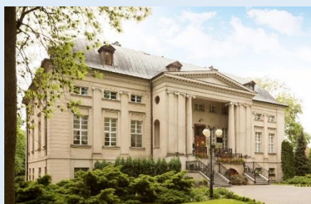
Pakosław - pałac z końca XVIII wieku , projekt Carla Gotharda Langhansa