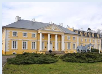
RACOT – XVIII-wieczny pałac w stylu klasycystycznym, projekt Dominika Merliniego, Stadnina Koni Racot, rezydencja prezydentów II RP.

Obiekt zwiedzamy zamiennie z pałacem w Drzeczkwie