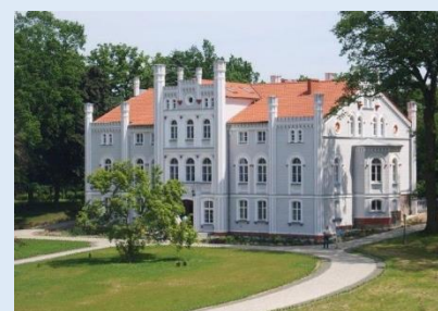
Drzeczkowo – zespół pałacowo – parkowy, neogotycki pałac z XIX w.