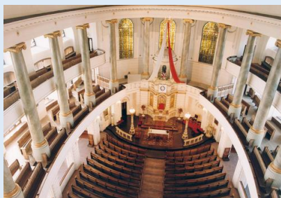
Rawicz - Kościół św. Andrzeja Boboli, projekt Carla Gotharda Langhansa, przełom XVIII/XIX wieku