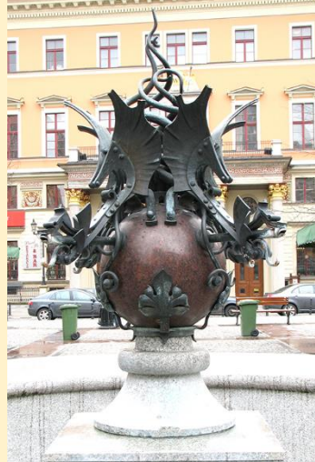
Wybrane prace Ryszarda Mazura w przestrzeni Wrocławia